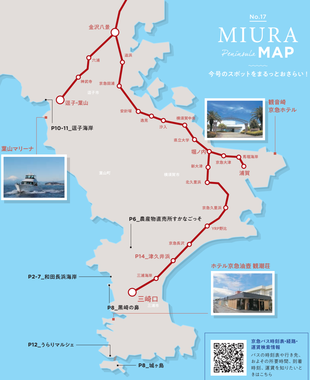
観音崎 京急ホテル